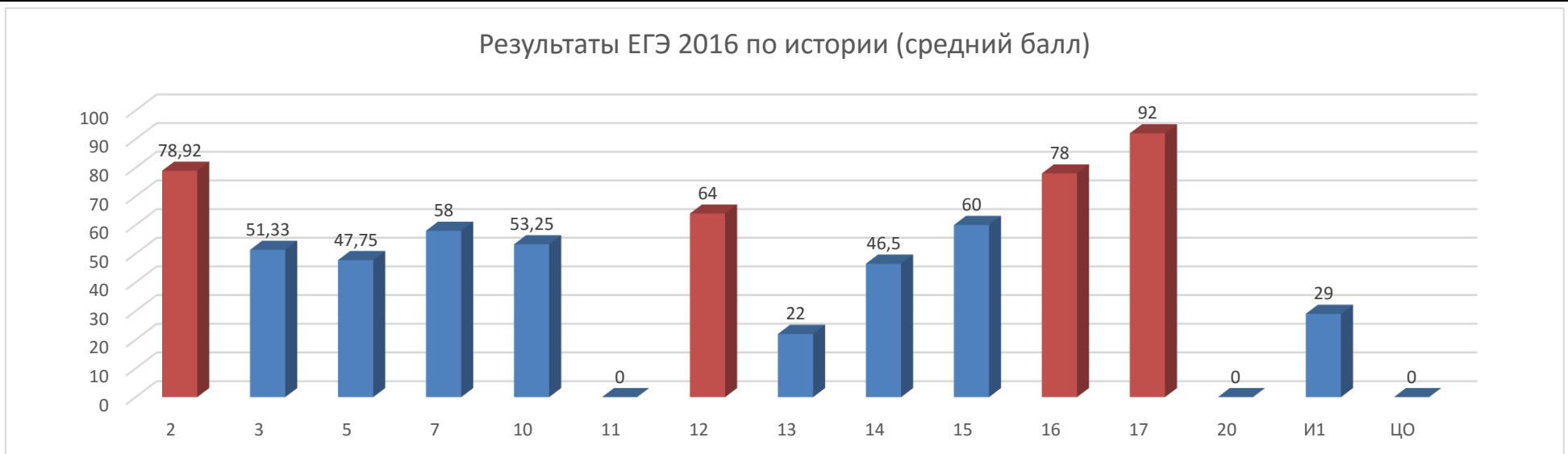
Результаты ЕГЭ 2016 по истории (средний балл)

Результаты по показателю «средний балл» выше среднегородского в ОО №