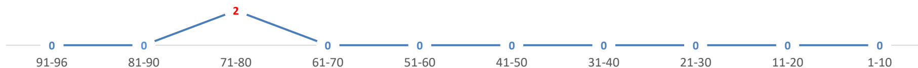
РАСПРЕДЕЛЕНИЕ УЧАСТНИКОВ ЕГЭ 2017 ПО ГЕОГРАФИИ, ПОЛУЧИВШИХ БАЛЛЫ В СООТВЕТСТВУЮЩИХ ИНТЕРВАЛАХ, ЧЕЛ.