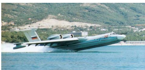
8. А-40 «Альбатрос»