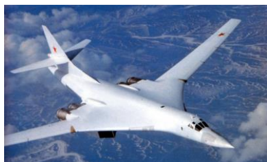
7. ТУ-160 «Белый лебедь»