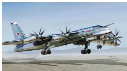
10. ТУ-95 «Медведь»