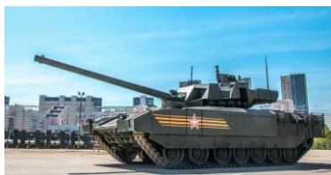
1. Т-14 «Армата»

Выберите из предложенного списка названия вооружения российской армии и подпишите их под соответствующей картинкой: