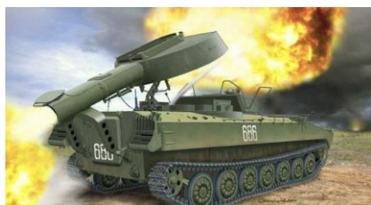
4. УР-77 «Змей Горыныч»