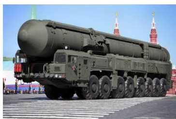
5. РТ-2ПМ2 «Тополь-М»