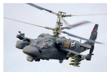
9. КА-52 «Аллигатор»