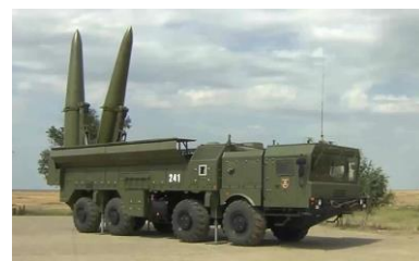
6. ОТРК «Искандер-М»