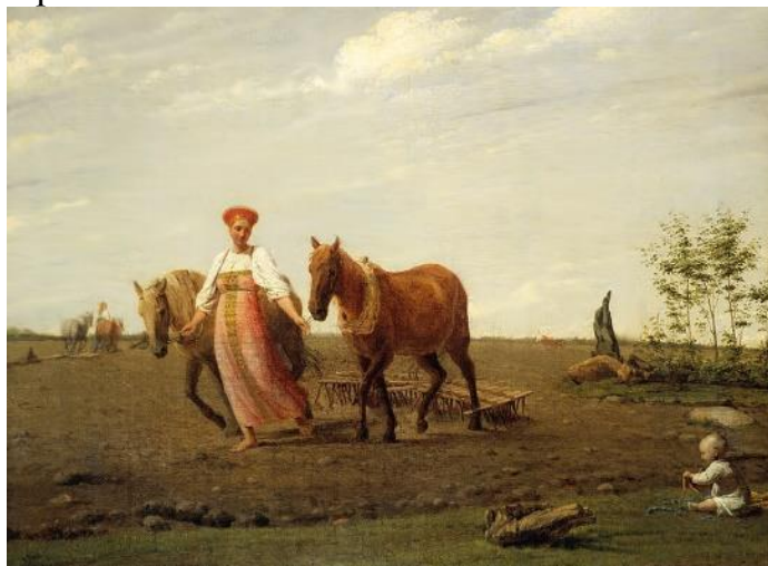
«На пашне. Весна». (2б.)

5. Перед вами самое загадочное произведение знаменитого русского художника Алексея Гавриловича Венецианова. Узнайте произведение художника по фрагменту. Опишите, что окружает данный фрагмент, сколько человеческих фигур изображено на картине, поразмышляйте над символикой образов. Напишите 5-6 слов или словосочетаний, передающих настроение работы. Укажите местонахождение картины.