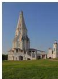
3. Церковь Вознесения Господня в Коломенском (Москва)