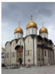
1. Успенский собор в Московском Кремле