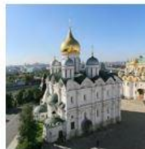
4. Архангельский собор в Московском Кремле