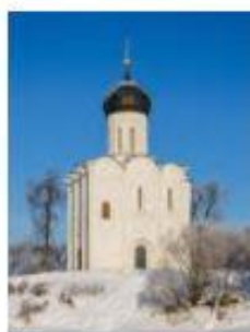
2. Храм Покрова Пресвятой Богородицы на Нерли